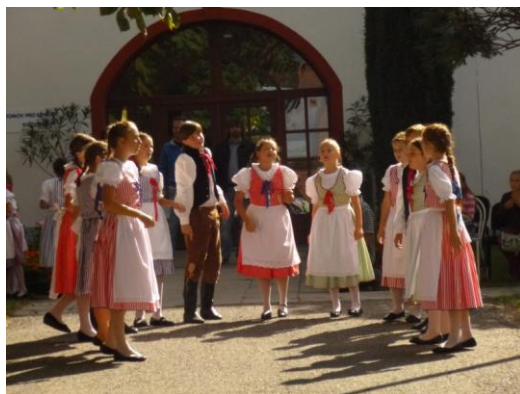
Ilustrační foto z předešlých slavností

Hudební doprovod: Talisman - kapela pana Kováře z Oseka