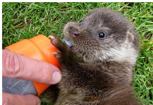
Ukázka ze záchrané stanice živočichů Makov.

Výlet do Makova 8.7. Narozeninový den 21. 7. Pouťová zábava 29. 7. Výlet do Hoslovic 5.8. Mezinárodní folklórní festival srpen (kolem 12.8.) Narozeninový den 18.8. Zámecká slavnost 12.9. Narozeninový den 22.9.